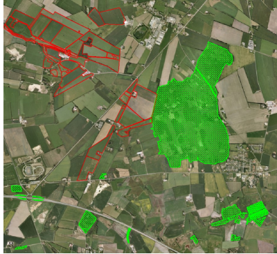
Figur 2. Temaet "Potentiel ammoniak følsom skov" fra Danmarks Miljøportal er hentet ind i eget GIS via WMS.

Kortlaget kan som nævnt hverken downloades eller hentes ind i eget GIS via WFS, men kun som WMS. Det betyder, at det er muligt at se GIS-temaet i eget GIS, men ikke se de bagvedliggende data eller klikke til polygonerne.